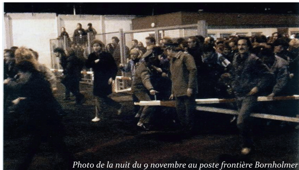
Photo de la nuit du 9 novembre au poste frontière Bornholmer

Avec le recul, je ne sais pas si nous avons compris l'ampleur historique du moment. C'était plutôt un moment historique personnel pour nous - cette ouverture vers ce monde dont nous rêvions tant mais qui nous était inaccessible. Il y avait une ambiance incroyable, les gens pleuraient, riaient, les Berlinois de l'Ouest nous ont accueilli en