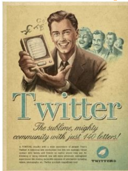
Annonces vintage.